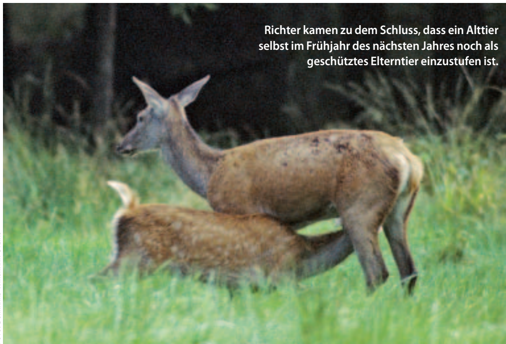
Richter kamen zu dem Schluss, dass ein Alttier selbst im Frühjahr des nächsten Jahres noch als geschütztes Elterntier einzustufen ist.

notwendige Elterntier genommen, so dass den Jungtieren der Hungertod droht.