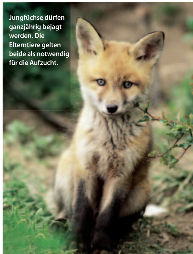
Jungfüchse dürfen ganzjährig bejagt werden. Die Elterntiere gelten beide als notwendig für die Aufzucht.

4. Der Verlust allein der Führung durch das Elterntier ist zumindest ein erheblicher Verstoß gegen die Waidge-