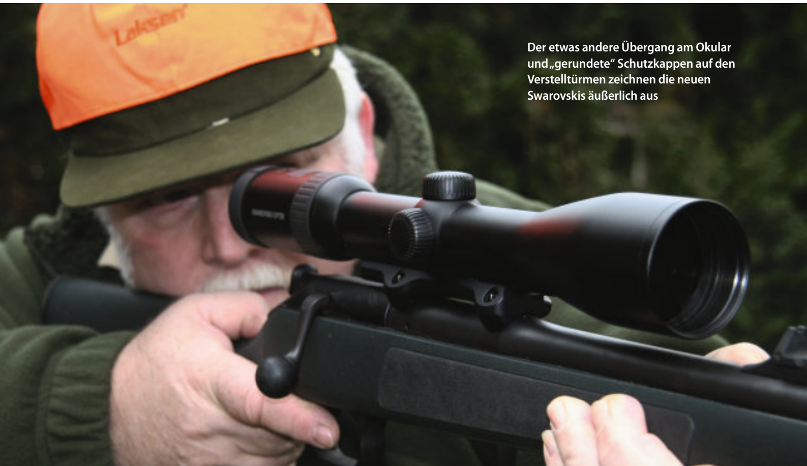
Der etwas andere Übergang am Okular und „gerundete“ Schutzkappen auf den Verstelltürmen zeichnen die neuen Swarovskis äußerlich aus

E in Autohersteller, dem es gelingt, eine Limousine zu bauen, die von Null auf Hundert in drei Sekunden beschleunigt und 25 Prozent weniger Sprit als alle anderen schluckt, wäre mit Sicherheit in aller Munde. Die Print-Medien überschlugen sich, und nicht wenige Kunden in den Startlöchern würden ungeduldig mit den Hufen scharren. Doch noch bleibt das eine Vision. Realität dagegen ist einer in seiner Dimension durchaus vergleichbarer optischer Genie-Streich geworden: Swarovskis Z 6-Serie.