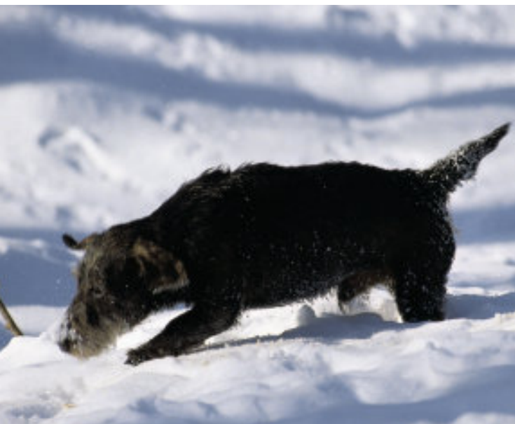
Fährten- oder Spurarbeit mit sicherem Laut sind für brauchbare Stöberhunde ein Muss

Ein Jagdhund braucht je nach Rasse mehr oder weniger viel Bewegung im Freien. Das bedeutet auch, dass man täglich für ihn die Zeit aufbringen muss, und die Möglichkeit hat, ihm entsprechenden Auslauf zu bieten. Zwei Stunden täglich sind das Minimum. Morgens und abends sind Spaziergänge Pflicht, am besten auch noch in der Mittagspause. Er benötigt Futter, Ausrüstung und Gesundheitsvorsorge, er kostet Hundesteuer und Haftpflichtversicherung, eventuell sind die Beiträge zu einem Zucht- oder Prüfungsverein aufzubringen. Für die laufenden Kosten sollten 50 Euro pro Monat angesetzt werden. Außerdem muss man ihn erst einmal kaufen. Gute Jagdhundwelpen kosten je nach Rasse zwischen 400 und 2 000 Euro.