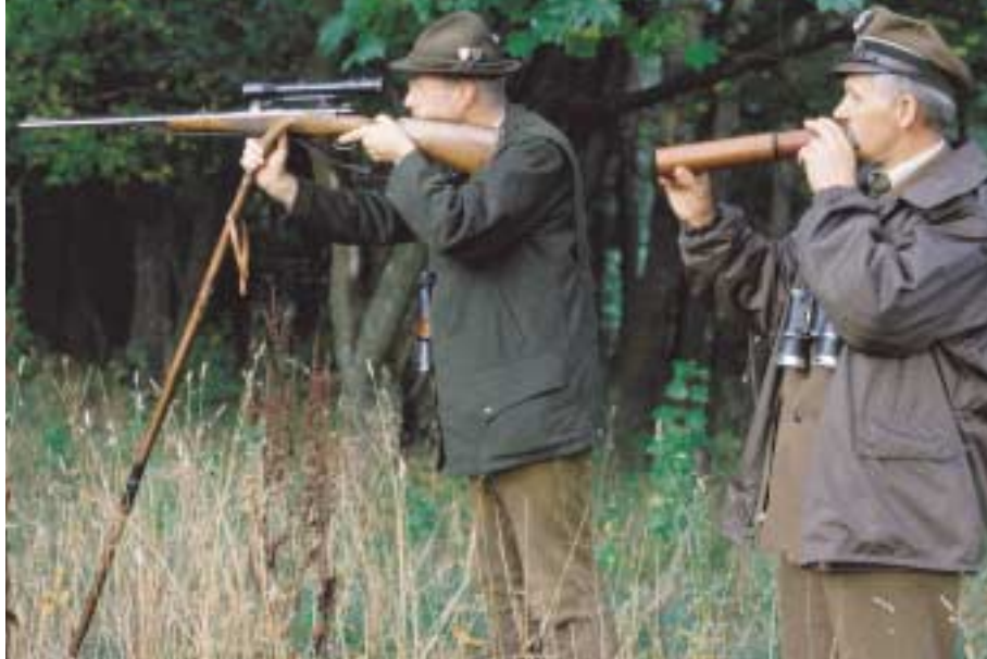
Vertrauen Sie dem Berufsjäger: Junge Jagdführer gehen häufig den Extra-Kilometer, der Sie ans Wild bringt. Ältere Jagdführer machen vieles durch ihre Erfahrung wett

Ein Beispiel: In Bulgarien im letzten Herbst hatte ich einen Berufsjäger, der mit mir bei schlechtem Wind durch ein langgezogenes tiefes Tal pirschte. Da er nur Bulgarisch verstand, versuchte ihm mit Händen und Füßen klarzumachen, dass das bei dem Wind nicht klappen könne, aber er winkte einfach nur ab und ging unbeirrt seinen Weg. Plötzlich machte das Tal eine große Biegung, und wir konnten bei gutem Wind weiterpirschen und hatten viel Anblick. Als ich später die Revierkarte sah, leuchtete mir ein, dass man nur über den Umweg mit dem schlechten Wind überhaupt in den wildträchtigen Bereich des Tales hereinkommen konnte – im Zweifel also immer für den Berufsjäger.