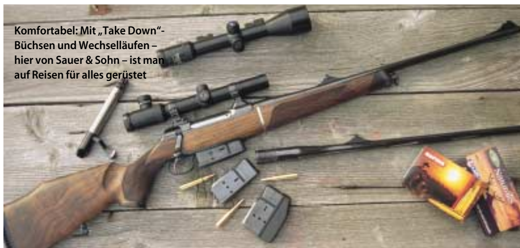
Komfortabel: Mit „Take Down“-Büchsen und Wechselläufen – hier von Sauer & Sohn – ist man auf Reisen für alles gerüstet

Stellen Sie auf der Auslandsjagd Ihr variables Zielfernrohr nie auf die maximale Vergrößerung. Wenn es schnell gehen muss, sind Sie mit zwei- bis vierfach sofort im Bilde. Wenn Sie doch einmal weit schießen müssen, haben Sie immer noch genug Zeit, „hochzudrehen“. Umgekehrt fehlt Ihnen aber die entscheidende Sekunde zum „runterdrehen“, wenn es brenzlich wird oder Wild in der Nähe auftaucht.