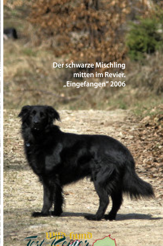
Der schwarze Mischling mitten im Revier. „Eingefangen“ 2006