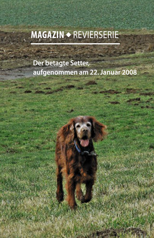
Der betagte Setter, aufgenommen am 22. Januar 2008