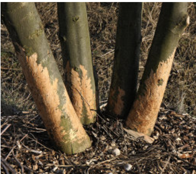
Die Kaninchen lieben Gräser, Triebe, Knospen – machen aber auch nicht vor jungen Bäumen, wie diesen hier, Halt.

Der Boden vor uns sieht aus wie ein Stück Schweizer Käse. Überall graben sich die Karnickel durch. Die emsigen Bauarbeiter machen auch vor den Weinhängen nicht Halt. „Da kippt dann schon mal ein Schmalspurtrecker um, wenn er mit einem Rad in solch einer tiefen Röhre hängenbleibt.“