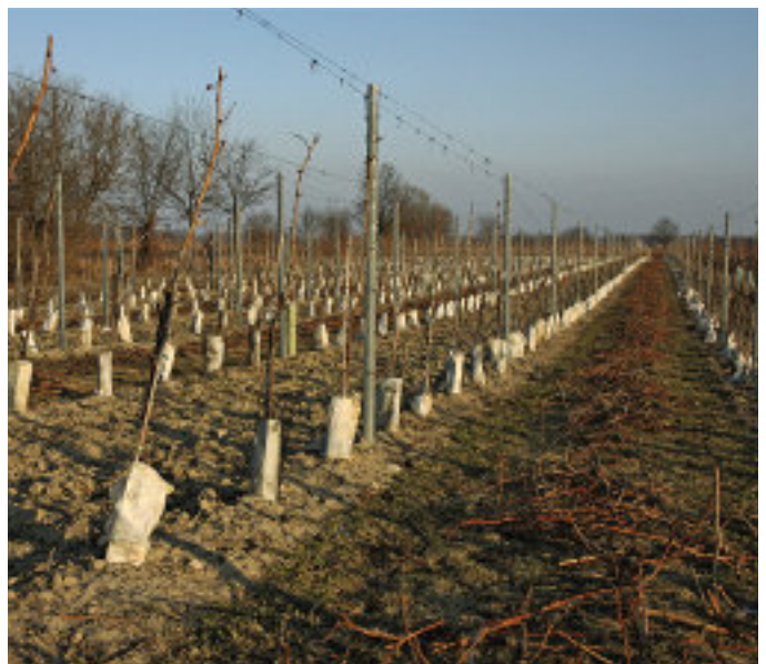
Die Winzer versuchen, die Rebstöcke mit Plastikummwicklung vor den gefräßigen Karnickeln zu schützen.