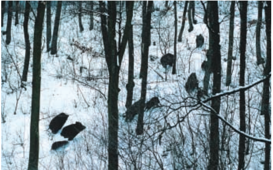
Während Rot- und Damwild gerne mit dem Hang zieht und flüchtet, nehmen Sauen einen Steilhang auch einmal direkt an

Ansitzböcke mit einer Bodenhöhe von etwa anderthalb Metern sind stets ein probates Mittel, um Schützen im ebenen Gelände einen sicheren Schuss zu ermöglichen. In Stangenhölzern kommt man damit aber sehr schnell in den Kronenbereich und hat plötzlich kein ausreichendes Schussfeld mehr. Sind sie aus Sicherheitsgründen unerlässlich, so kommt man um entsprechende Pflegeeingriffe nicht herum. Andererseits können Ansitzböcke aber in Flächen mit unregelmäßiger Verjüngung ausgesprochen hilfreich sein. Schon knapp mannshohe Verjüngungen von stubengröße werden von Rehen gerne als Deckung angenommen. Vom Ansitzbock aus kann man große Bereiche übersehen und bejagen.