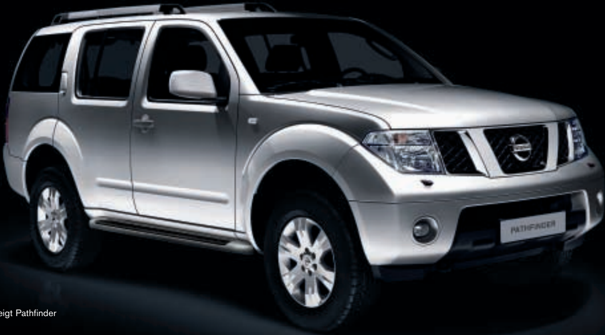
Abb. zeigt Pathfinder