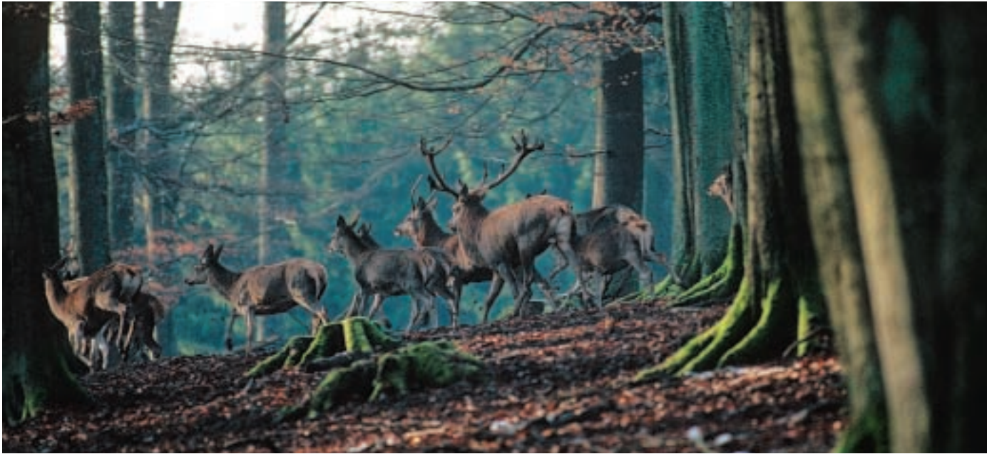
Rotwild wechselt als „Augentier“ gerne an Hangkanten entlang, um bei der Flucht möglichst viel äugen zu können

lich auftritt und wenig berechenbar ist. Dies ist zum Beispiel dann der Fall, wenn binnen einer halben Stunde 20 Schützen und acht Hunde auf 100 Hektar auftauchen und die Hunde sofort geschnallt werden.