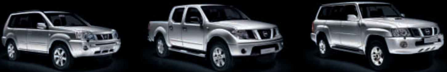
Abb. zeigt X-TRAIL, Navara, Patrol