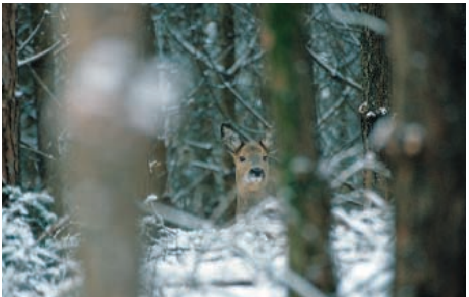
Rehwild ist territorial und verlässt ungern die Dichtung. Sie machen Widergänge, drücken sich und versuchen, im Dunklen zu bleiben. Ein Stand im Stangenholz verspricht Erfolg

Grundsätzlich sollten die Stände in Verjüngungsflächen oder in Stangenhölzern gefunden werden.