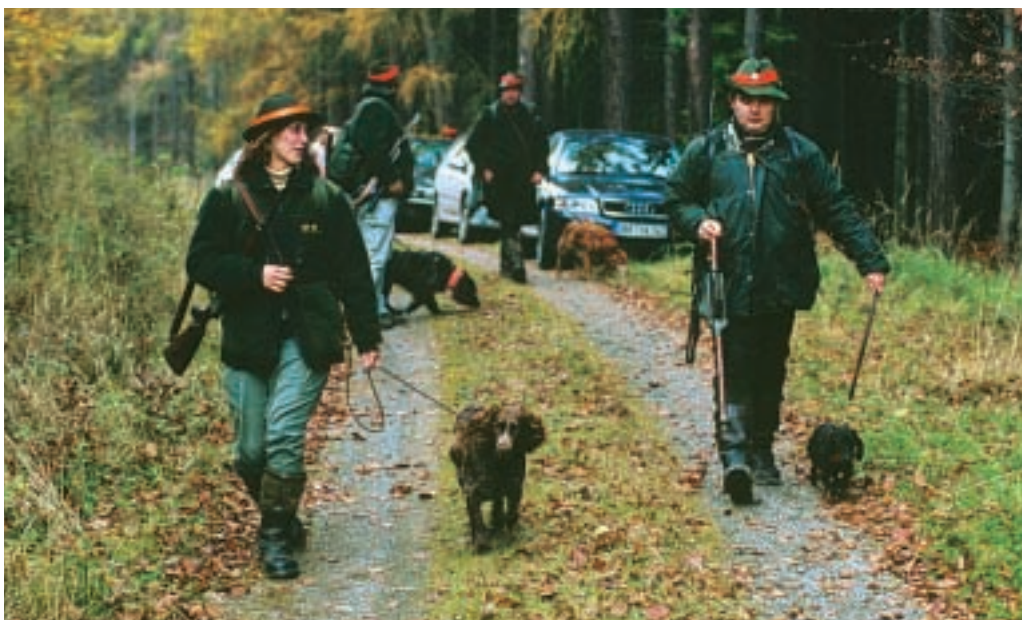
Der Erfolg einer Bewegungsjagd steht und fällt mit dem richtigen Einsatz solojagender, fährtenlauter Hunde. Die Erfahrung zeigt, dass auf den Jagden eher zu wenig Hunde im Einsatz sind

Die „anspruchloseste“ Wildart diesbezüglich ist das Schwarzwild. Kurze Wege zwischen zwei Deckungsbereichen sind wichtig. Dabei spielt die Steilheit des Geländes so gut wie keine Rolle. Ein Graben oder eine Furche als Deckung wird gern genommen, Hauptsache der Weg in die nächste Dichtung ist kurz und dem Wild vertraut (Wechsel). Es können und sollten Wechsel auch mehrfach besetzt werden. Da es beim Einsatz von Stöberhunden nicht das Ziel ist, die Rotten zu sprengen, ist es vorteilhaft, wenn eine Bache mit ihren Frischlingen mehreren Schützen vor die Büchse kommt. →