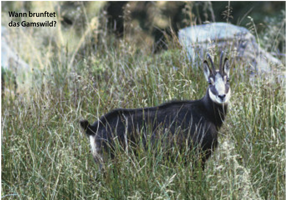
Wann brunftet das Gamswild?

14. Bei welchen Marderarten kommt es nicht zu einer Ei-beziehungsweise Keimruhe?