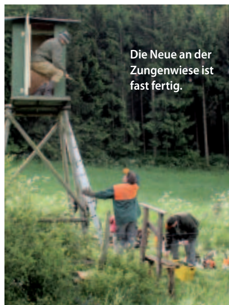
Die Neue an der Zungenwiese ist fast fertig.

Als sich die Nacht über den Wald senkt, sind alle tierisch nass, haben aber mächtig was weggepackt. Ein Schirm am Limes wurde neu errichtet. Eine Kanzel, die der Bauer mit seinem Traktor angefahren hatte, stand nachher wieder in der Waage, eine Leiter am Schlüsselgraben wurde verstrebt, eine Kanzeltür neu eingebaut. Die Heidekanzel er-