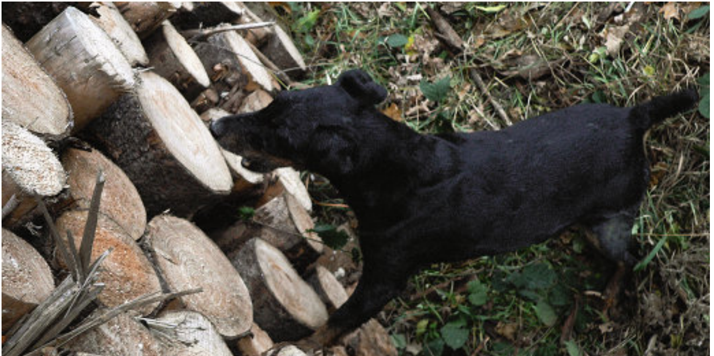
Terrierrüde „Elk“ macht Alarm, denn zwischen den Stämmen hat sich ein stammer Marder versteckt.

Nach jedem Einsatz müssen die Vierläufer auf Dornen oder Holzsplitter un-