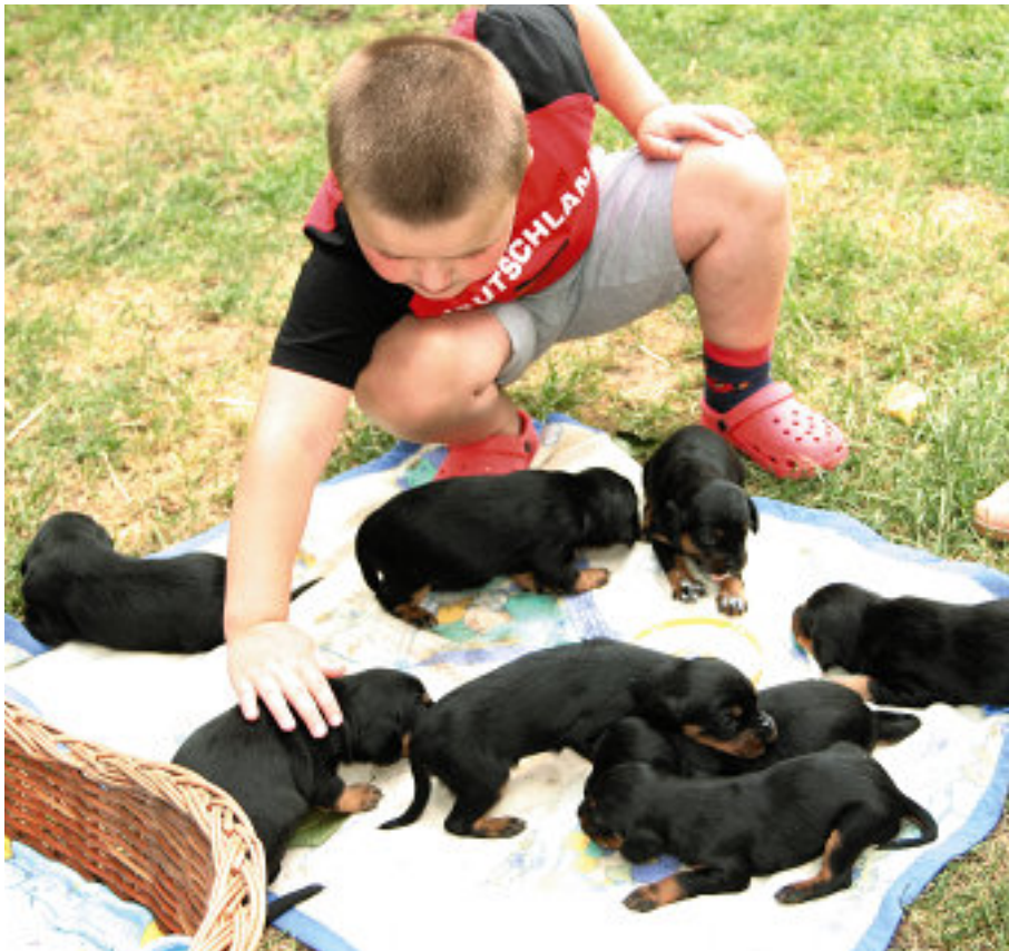
Die Vorfreude auf den Nachfolger des altgedienten Kurzhaares beginnt schon mit dem ersten Besuch beim Züchter.