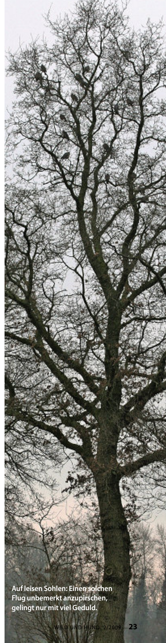
Auf leisen Sohlen: Einen solchen Flug unbemerkt anzupirschen, gelingt nur mit viel Geduld.