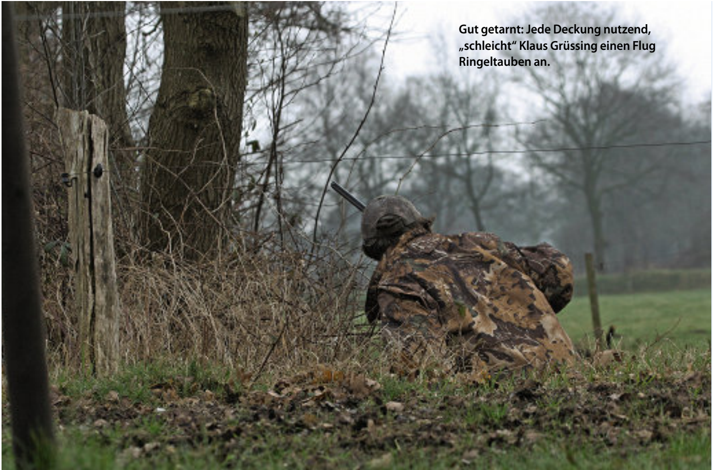
Gut getarnt: Jede Deckung nutzend, „schleicht“ Klaus Grüssing einen Flug Ringeltauben an.

A uf allen Vieren kriecht Klaus Grüssing ein Stück weiter, hält inne und hebt vorsichtig den Kopf. Doch trotz Tarnbekleidung und behutsamen Pirschens machen die Ringeltauben bereits einen „langen Hals“ und streichen kurz darauf mit klatschenden Flügelschlägen ab.