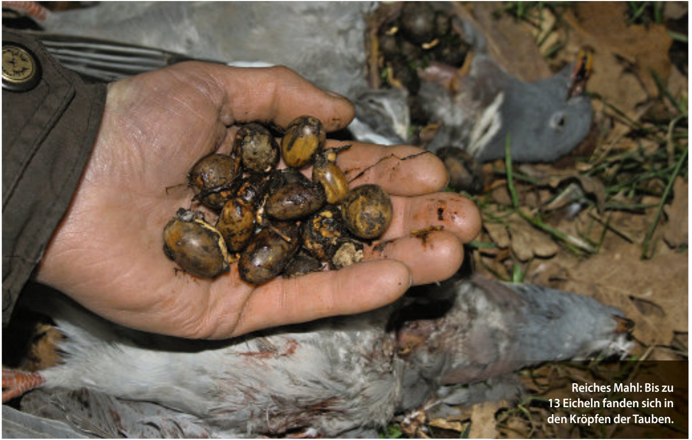
Reiches Mahl: Bis zu 13 Eicheln fanden sich in den Kröpfen der Tauben.