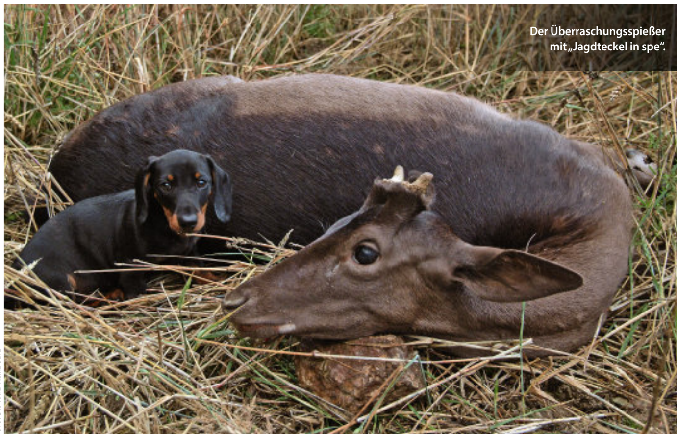
Der Überraschungsspießer mit „Jagdteckel in spe“.

Es ist schon ein sonderbares Gefühl, im Damwildring Mitglied zu sein, Abschussfreigaben zu diskutieren, aber kaum am Jagderfolg zu partizipieren. Manchmal gibt es allerdings Ausnahmen.