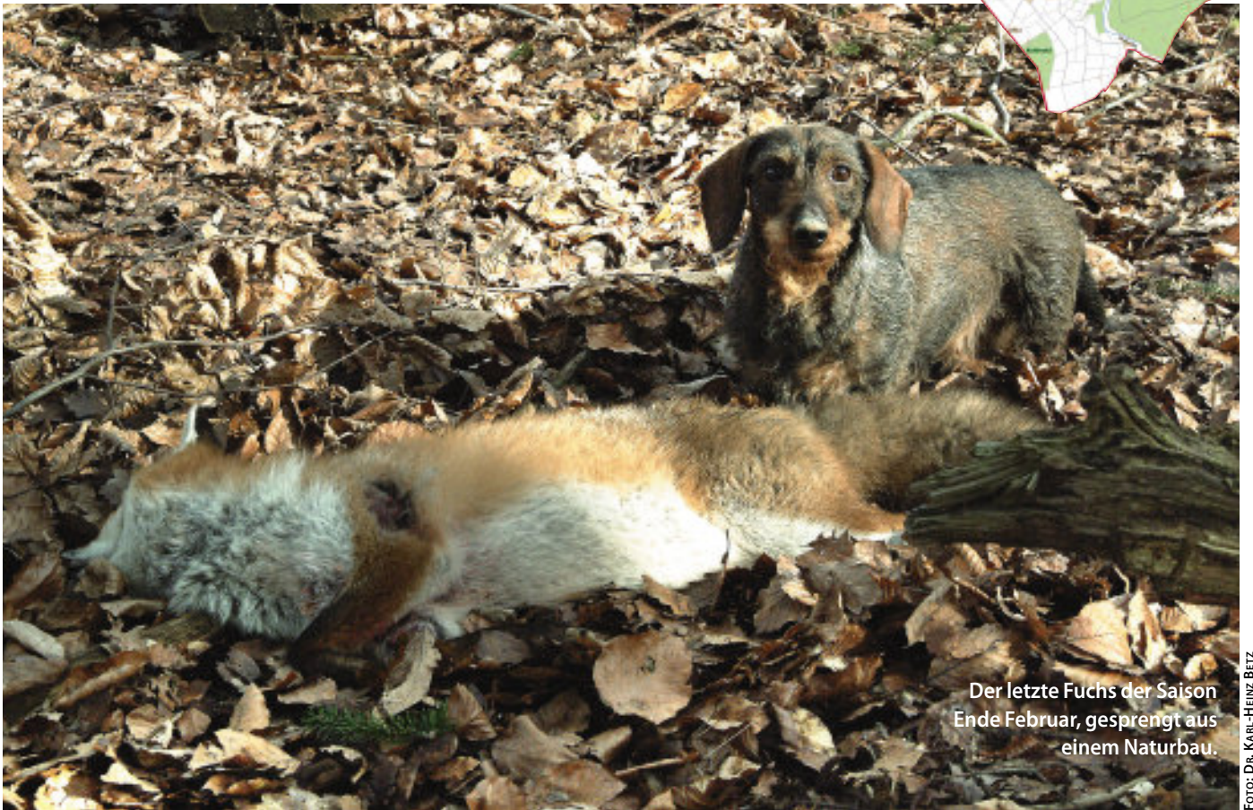
Der letzte Fuchs der Saison Ende Februar, gesprengt aus einem Naturbau.