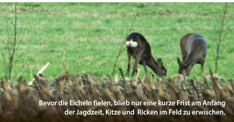
Bevor die Eicheln fielen, blieb nur eine kurze Frist am Anfang der Jagdzeit, Kitze und Ricken im Feld zu erwischen.

Also kann es im neuen Jagdjahr nur besser werden. An uns wird es nicht liegen, fraglich nur, ob das Wetter diesmal ein wenig besser mitspielen wird. bz