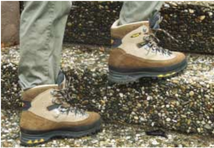
„Revolution“ für Damenfüße: Meindls „Air Revolution“ mit Gore-Tex- Membran