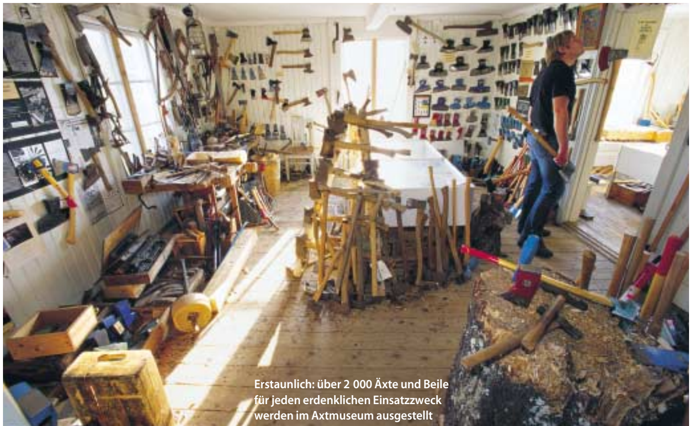
Erstaunlich: über 2 000 Äxte und Beile für jeden erdenklichen Einsatzzweck werden im Axtmuseum ausgestellt

ber angeeignet, wie Menschen in allen Erdteilen die Geräte nach ihren jeweiligen Bedürfnissen entwickelt und welche Bedeutung sie ihnen gegeben haben. „In der griechischen Mythologie war die doppelschneidige Axt ein Sinnbild für den zunehmenden und abnehmenden Mond und somit für Leben und Tod“, berichtet Brånby. Und die Indianer Nordamerikas verwendeten das aus Europa eingeführte Minibeil als Universalwerkzeug, Zahlungsmittel und Kultobjekt. So verzierten die Ureinwohner das Tomahawk aufwendig, höhlten den Stiel aus und benutzten es als Pfeife bei rituellen Handlungen.