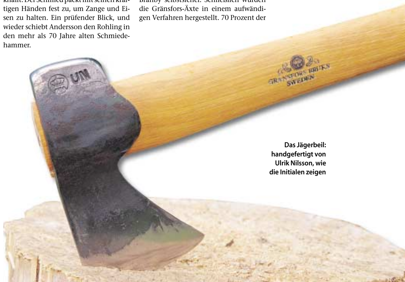
Das Jägerbeil: handgefertigt von Ulrik Nilsson, wie die Initialen zeigen