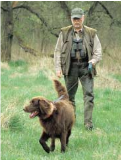
Die „Vorauspirsch“ wird zunächst an der Laufleine geübt. Drosselt der Hund sein ...

Immer dann, wenn der Hund wieder etwa vier Meter vor mir her läuft und diese Entfernung überschreitet, tritt die Sperre der Laufleine in Aktion und erneut ertönt „Laaangsam“. Nimmt der Hund sein Tempo nicht zurück, erfolgt ein kräftiger Ruck an der Leine, und es heißt „Halt!“. Nach einigen Übungen verknüpft unser Jagdhelfer, dass er nicht weiter als maximal vier Meter vor uns her gehen darf, da sonst der unangenehme Ruck an der Halsung folgt. Und immer, wenn Sie stehenbleiben, hat auch der Hund zu verharren, und wenn Sie sich hinknien, muss auch er in die Haltlage.