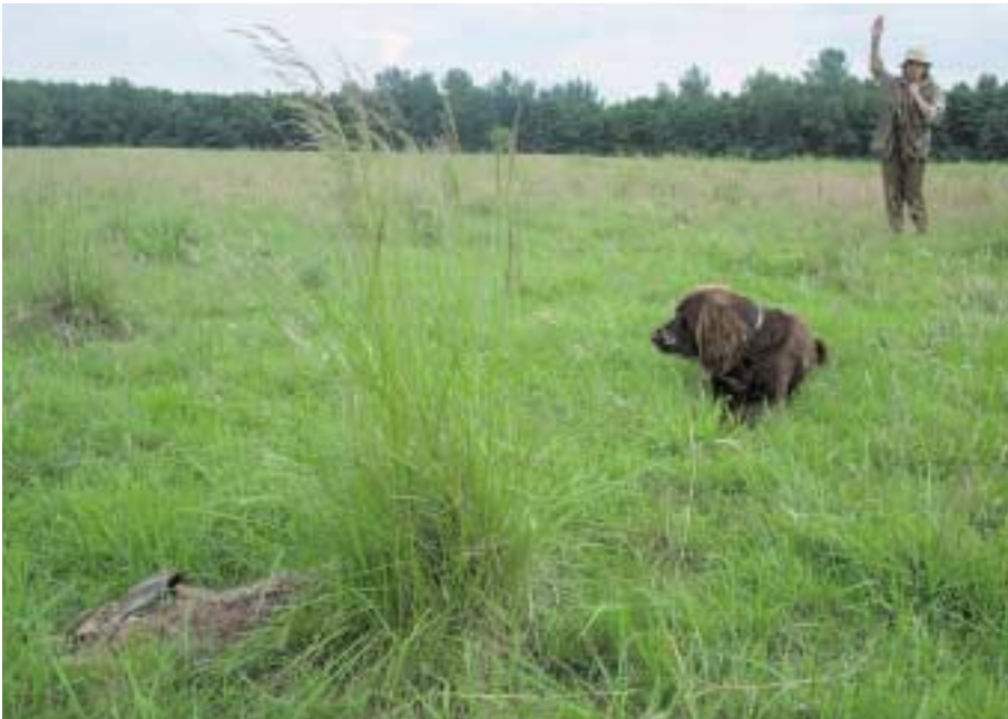
Bevor der Vierläufer für die freie Pirsch ausgebildet wird, muss er absoluten Gehorsam am Wild zeigen. Ansonsten wäre er ein unkalkulierbares Risiko beim Reviergang

Mit den Übungen für die Ausbildung zum Pirschbegleiter können Sie also erst sinnvoll beginnen, wenn der Hund das