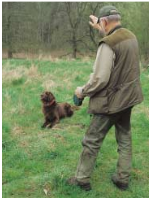
... Tempo auf Zuruf nicht, wird er mit einem Ruck regelmäßig in die Haltlage geschickt

Kommt nun in einiger Entfernung ein Stück Wild in Anblick, bleiben Sie stehen. Der wildgehorsame Jagdhund – und das sollte der Vierläufer, wie gesagt, jetzt sein – wird verharren. Winken Sie ihn dann gelegentlich lautlos zu sich heran, „beäugen“ Sie das Stück beide gemeinsam und sprechen Sie dabei leise, be-