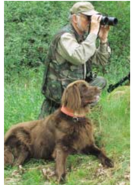
Hockt sich der Führer nieder, muss der Hund sofort in die Haltlage gehen

Voraussetzung ist in erster Linie der absolute Gehorsam des Vierläufers, insbe-