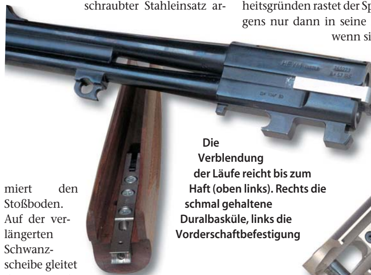
Die Verblendung der Läufe reicht bis zum Haft (oben links). Rechts die schmal gehaltene Duralbasküle, links die Vorderchaftbefestigung

In der sehr schmal gehaltenen Duralbasküle verriegelt das Bündel mittels eines breiten Keils, der in den massiven hinteren Laufhaken eintritt. Für seitliche Stabilität sorgen die hochgezogenen Flanken, und ein verschraubter Stahleinsatz ar-