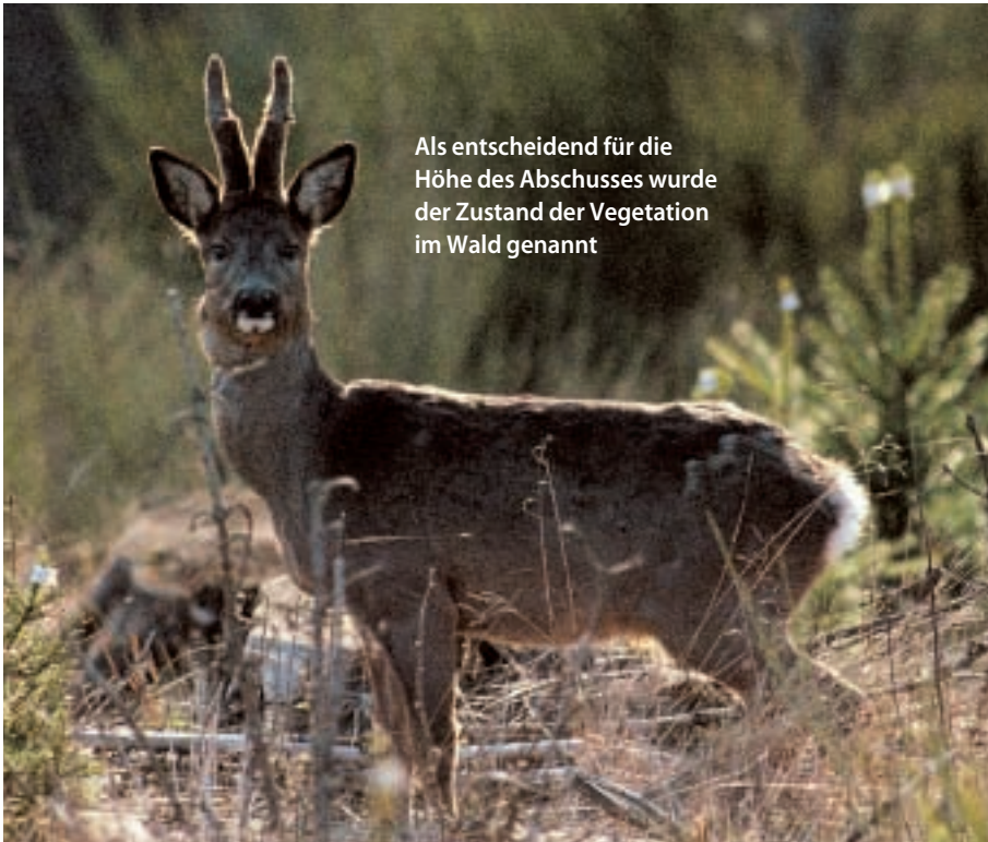
Als entscheidend für die Höhe des Abschusses wurde der Zustand der Vegetation im Wald genannt

Im Gegenteil: Wie der 67-Jährige, der seit über 30 Jahren dem Jägerzusammenschluss vorsteht, sagt, hat sich die Zusammenarbeit zwischen der Jägerschaft und Jagdgenossen deutlich verbessert. „Auf den Waldbegängen kommt man sich näher, und manches Problem kann im direkten Kontakt vor Ort gelöst werden. Wir vermissen die Behörde nicht.“