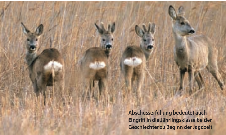
Abschusserfüllung bedeutet auch Eingriff in die Jährlingsklasse beider Geschlechter zu Beginn der Jagdzeit

Jaja, ich weiß schon, die Sache mit dem Forst. Doch in den Hochwildringen funktioniert es doch auch. Weiterhin könnte auf diesem Wege neben der Abschuss- auch eine gemeinschaftliche Lebensraumplanung – nicht nur im Sinne des Rehwildes – vorangetrieben werden. Darüber hinaus bestünde eine Flexibilität in Form der Abschussverschiebung. Falls ein Revier, aus welchen Gründen auch immer, den eingereichten Abschuss nicht erfüllen kann, wird er auf andere Jagdbezirke verteilt, die den Bestand bis dato unterschätzt hatten. Gänzlich ohne behördliche Nachbeantragung, sondern einfach und unkompliziert per Telefon mit dem Vorstand. Weiterhin besteht die Möglichkeit, auch andere Niederwildarten in die Obhut revierübergreifender Hege-