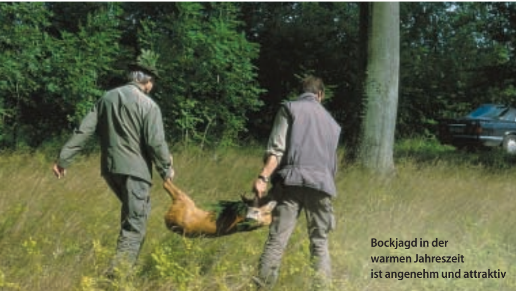
Bockjagd in der warmen Jahreszeit ist angenehm und attraktiv

Zusammenfassend über allem schwebt die Frage: Brauchen wir behördlich festge-