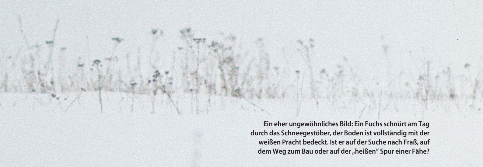
Ein eher ungewöhnliches Bild: Ein Fuchs schnürt am Tag durch das Schneegestöber, der Boden ist vollständig mit der weißen Pracht bedeckt. Ist er auf der Suche nach Fraß, auf dem Weg zum Bau oder auf der „heißen“ Spur einer Fähe?