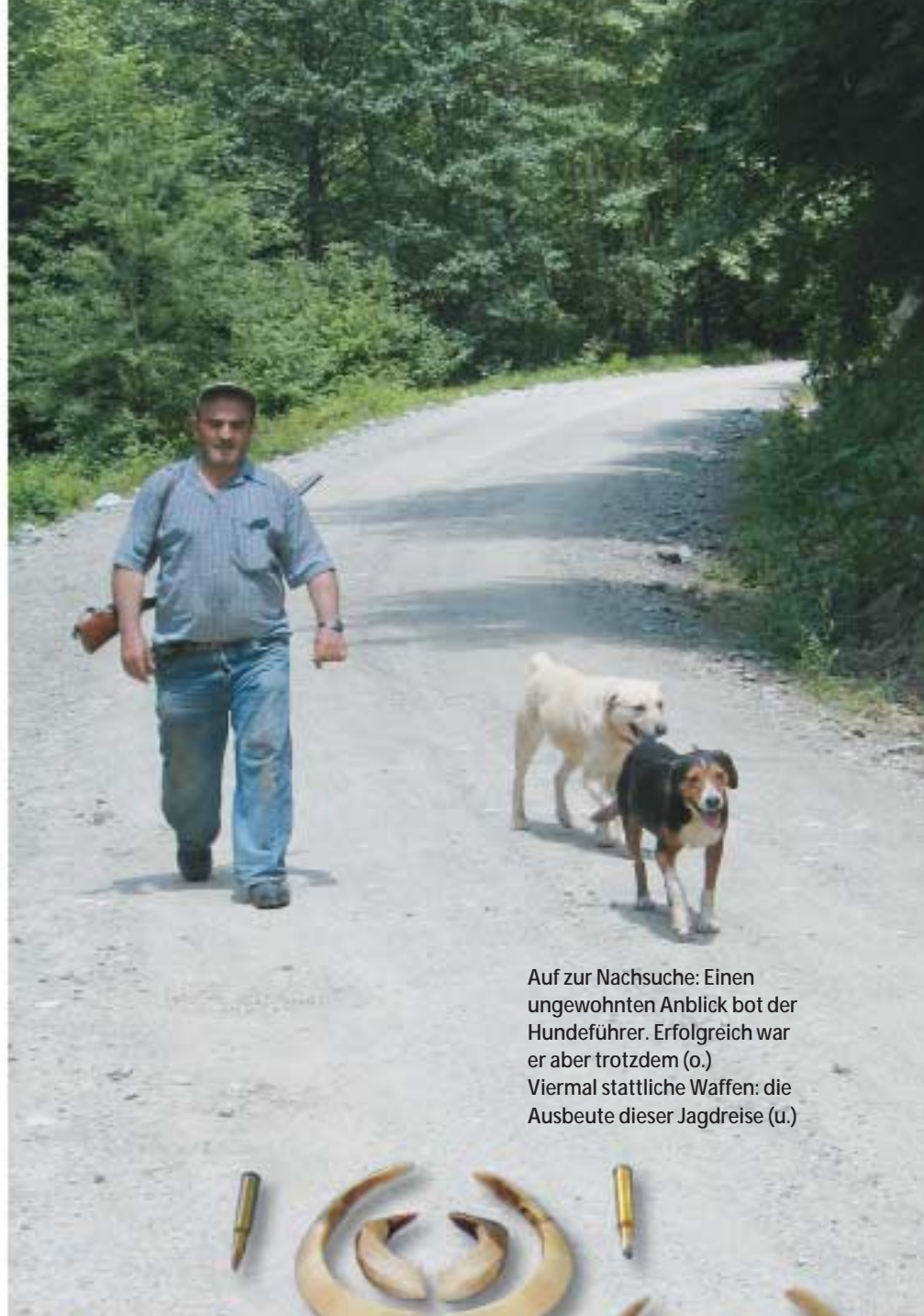
Auf zur Nachsuche: Einen ungewohnten Anblick bot der Hundeführer. Erfolgreich war er aber trotzdem (o.) Viermal stattliche Waffen: die Ausbeute dieser Jagdreise (u.)

Jetzt ist das Stück keine 60 Meter hinter uns. Wir können es hören, bis es links vor uns am Lichtungsrand verhofft. Wir warten gespannt. Nach 15 Minuten – gerade als die Wolken den Mond verdecken – wechselt vermutlich eine einzelne Sau ge-