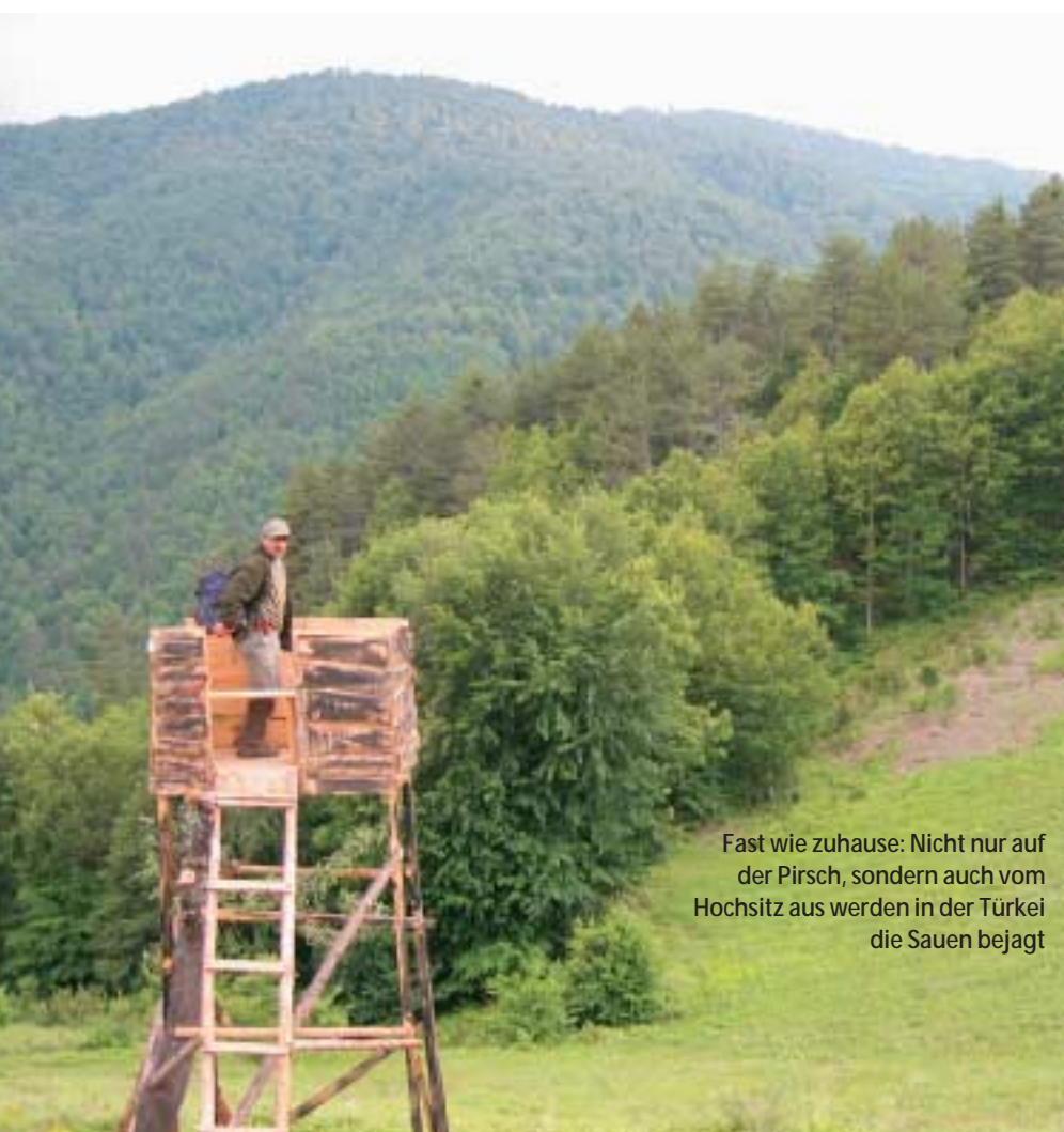
Fast wie zuhause: Nicht nur auf der Pirsch, sondern auch vom Hochsitz aus werden in der Türkei die Sauen bejagt

Am Sonntag fahren wir dann in die Hafenstadt Zongouladuk. Auch hier treffen wir sehr freundliche und offene Menschen. Beim Mittagessen in einem kleinen Hafent-