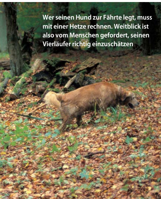
Wer seinen Hund zur Fährte legt, muss mit einer Hetze rechnen. Weitblick ist also vom Menschen gefordert, seinen Vierläufer richtig einzuschätzen

Wichtig ist, sofort nachzuladen und wieder in Anschlag zu gehen. Misstrauen ist angezeigt, wenn das Stück blitzartig zu-