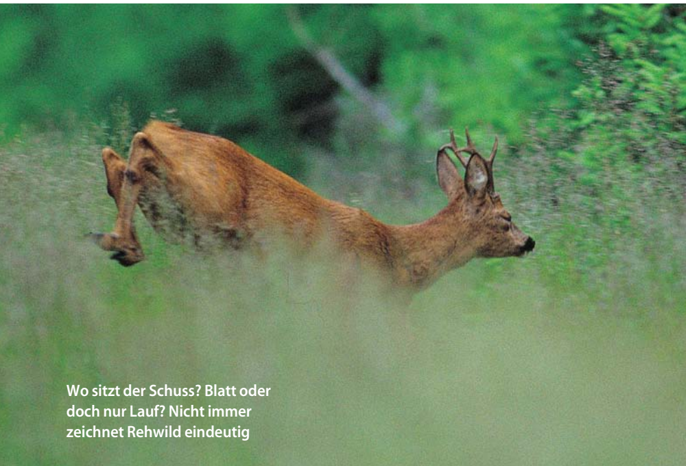
Wo sitzt der Schuss? Blatt oder doch nur Lauf? Nicht immer zeichnet Rehwild eindeutig

Warum gehen Nachsuchen auf Rehwild überdurchschnittlich oft erfolglos aus? Zum einen sind häufig die Witterungsbedingungen widrig, das heißt, es ist zu warm und zu trocken. Der Blütenstaub in Wiesen und Getreideschlägen macht der Hundennase zusätzlich zu schaffen. Nach Auffassung vieler Hundeführer, die sich jedes Jahr mit zahlreichen Krankschüssen befassen, liegt ein wesentlicher Grund im geringen Gewicht und im Fluchtverhalten der Rehe.