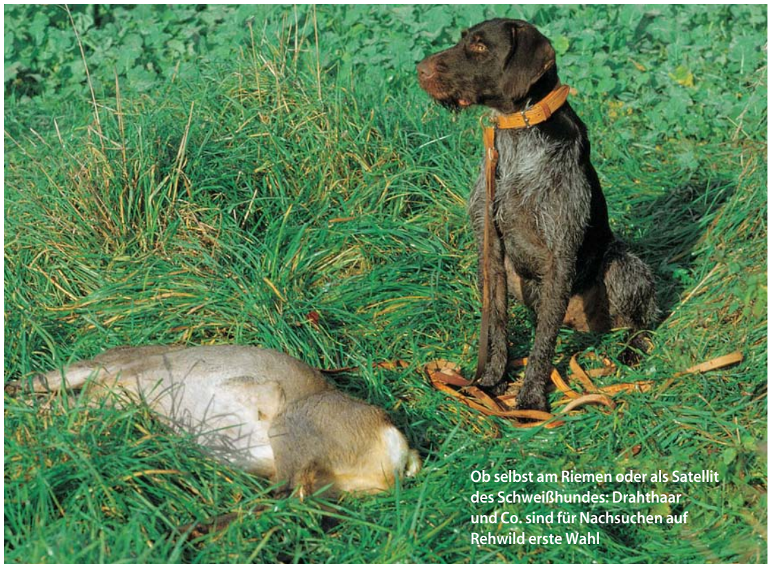
Ob selbst am Riemen oder als Satellit des Schweißhundes: Drahthaar und Co. sind für Nachsuchen auf Rehwild erste Wahl

Es ist keine Schande , einen Schweißhundeführer zu bestellen, wenn man etwas verbockt hat. Die Nachsuchengespanne kochen auch nur mit Wasser. Der Unterschied besteht aber darin, dass sie viel, viel öfter hinter dem Herd stehen. Deshalb brennt ihnen auch seltener etwas an. Das muss man nicht beweihräuchern oder mystifizieren, sondern einfach als logische Konsequenz ansehen und gegebenenfalls auch in Anspruch nehmen. Schändlich ist es, aus Eitelkeit, Scham und falschem Stolz ein Tier dahinsiechen zu lassen. 🌿