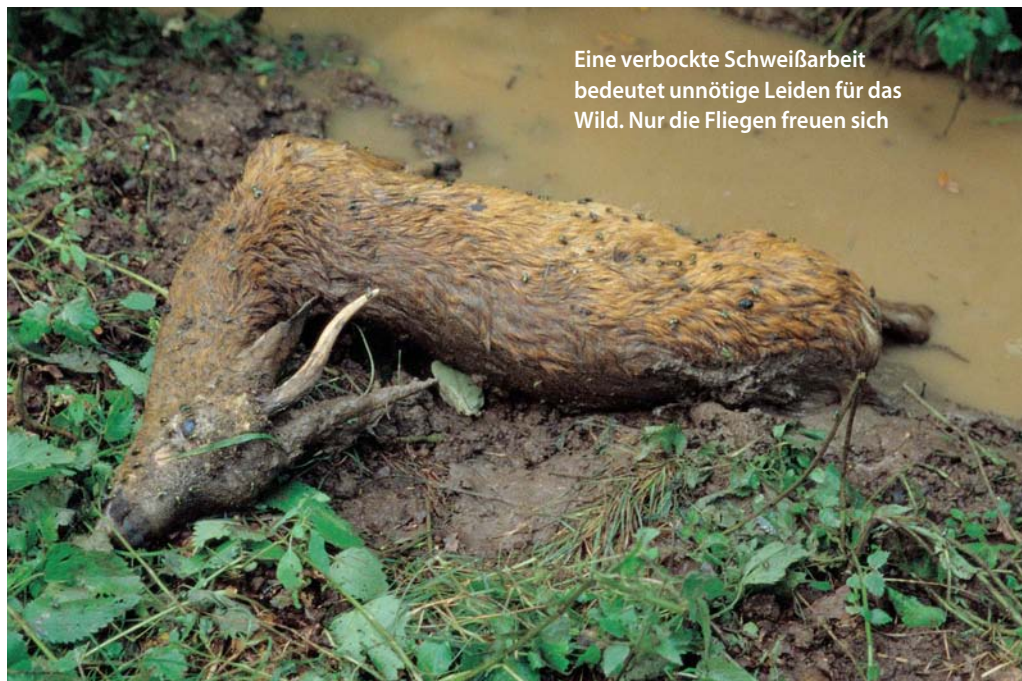
Eine verbockte Schweißarbeit bedeutet unnötige Leiden für das Wild. Nur die Fliegen freuen sich

Wildart wird so viel verbockt wie bei den kleinen Trughirschen. Und wer jetzt meint, dass es Jungjäger sind, die in ihrer Unerfahrenheit eine unglückliche Hand haben, der muss sich eines besseren belehren lassen: Genau das Gegenteil trifft zu! Es sind die erfahrenen Jäger, die schon oft über hundert Stücke gestreckt haben, die immer „höchstens ein paar Schritte weiter“ gelegen haben.