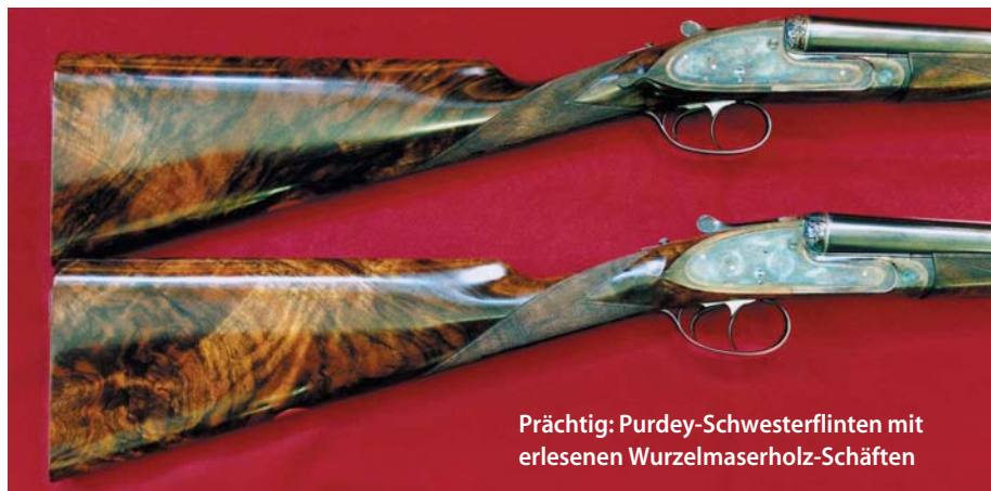
Prächtig: Purdey-Schwesterflinten mit erlesenen Wurzelmaserholz-Schäften

Informationen über „Purdeys“: Joh. Springer's Erben, Josefsplatz 10, 1080 Wien, Österreich, Tel. +43-1-4 06 11 04-11, Fax +43-1-4 06 12 26, oder bei James Purdey & Sons, 57-58 South Audley Street, London W1K 2ED, Großbritannien, www.purdey.com