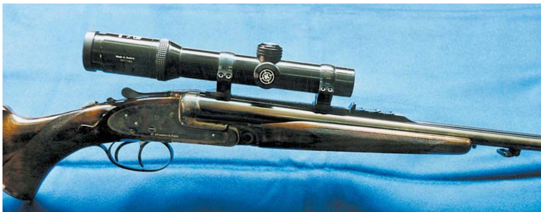
Nicht nur Flinten: Purdey stellt auch Kugelwaffen her. Hier die Doppelbüchse des Autors im Kaliber .300 H & H Magnum

Berauscht vor Freude, kehrte ich nach Belgien zurück. Und was ich nie vergessen werde: Für 25 englische Pfund ließ ich in Liège den gewünschten Lauf für den Drilling herstellen. Bereits ein bis zwei Wochen später war ich mit dem Lauf und den not-