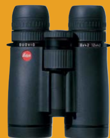
LEICA DUOVID 8 + 12 x 42

Leica Camera AG / Oskar-Barnack-Straße 11 / D-35606 Solms / Telefon 06442-208-111 / www.leica-camera.com