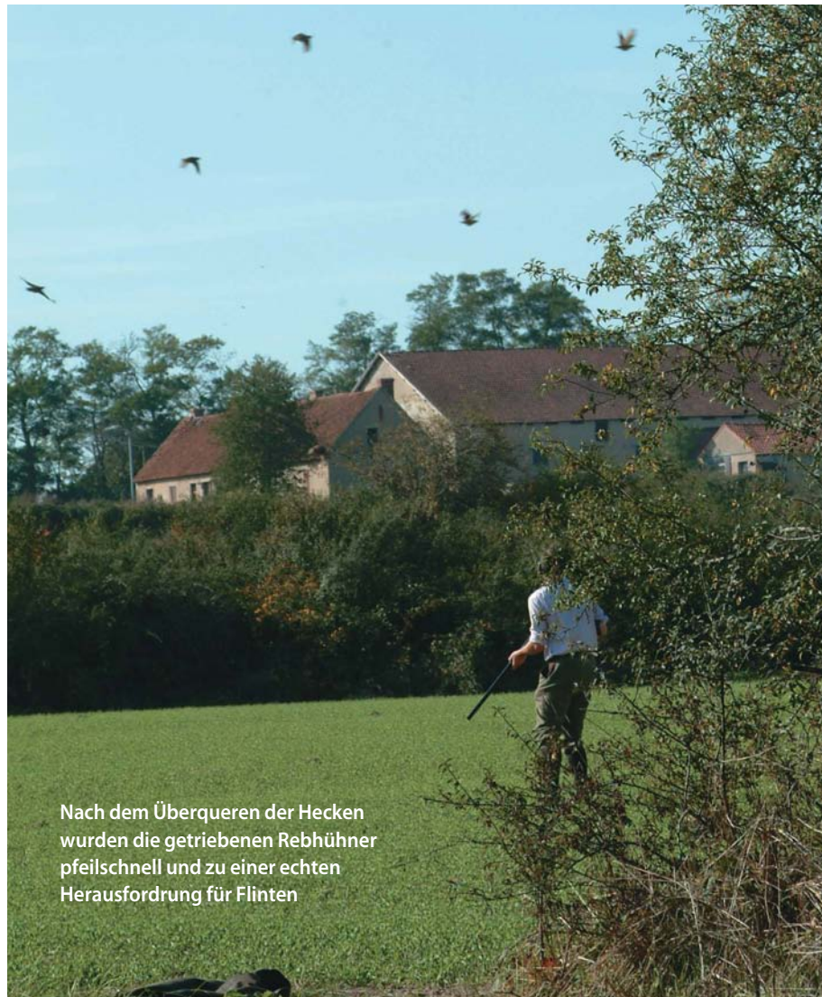
Nach dem Überqueren der Hecken wurden die getriebenen Rebhühner pfeilschnell und zu einer echten Herausforderung für Flinten

Nach Abschluss der Jagd trafen wir uns zu einem kühlen Weißem und ein paar Snacks auf der Terrasse des Chateaus bei immer noch herrlichem Sonnenschein