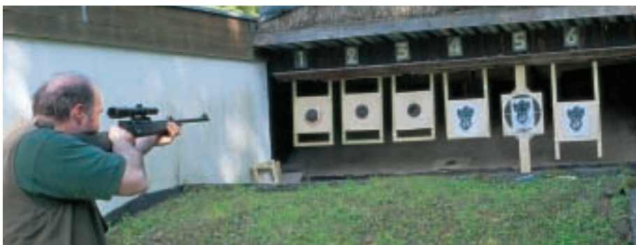
Drei Sekunden: So wenig Zeit blieben dem Schützen für Anschlag und Schussabgabe, dann kippte das Ziel wieder weg

on sicherlich den besten Kompromiss dar. Gut sichtbar erscheinen die Elemente, wenn das Licht auf sie einfällt, kritischer wird es bei Gegenlicht, und schlecht visiert es sich vom Hellen ins Dunkle. Liegen die Schussentfernungen aber jenseits der 50 Meter, wird das Wild in Relation zum Korn verdammt klein und von diesem weitgehend abgedeckt. Wer will da noch für einen guten Sitz der Kugel die Hand ins Feuer legen? Hier ruht also bei der preiswertesten aller Lösungen der Hase im Pfeffer.