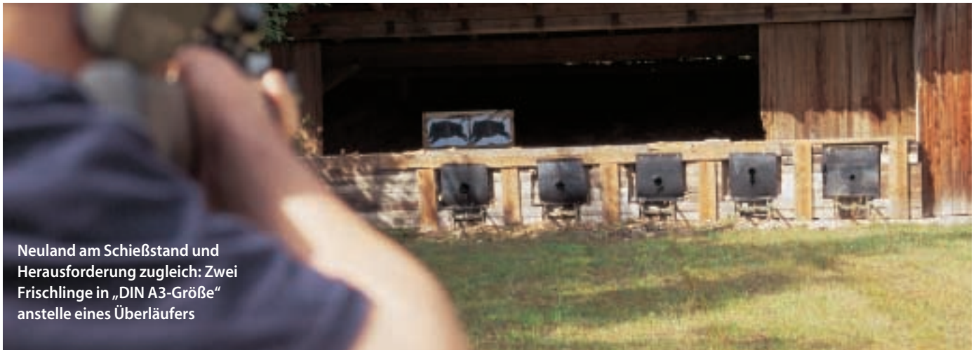
Neuland am Schießstand und Herausforderung zugleich: Zwei Frischlinge in „DIN A3-Größe“ anstelle eines Überläufers

Hergebrachten, nehmen das Zielfernrohr ab, wenn zur Sauhatz geblasen wird, und versuchen ihr Waidmannsheil auf ungewohnte Weise, nämlich über die im jagdlichen Alltag eher selten benutzte Hilfe von Kimme und Korn.