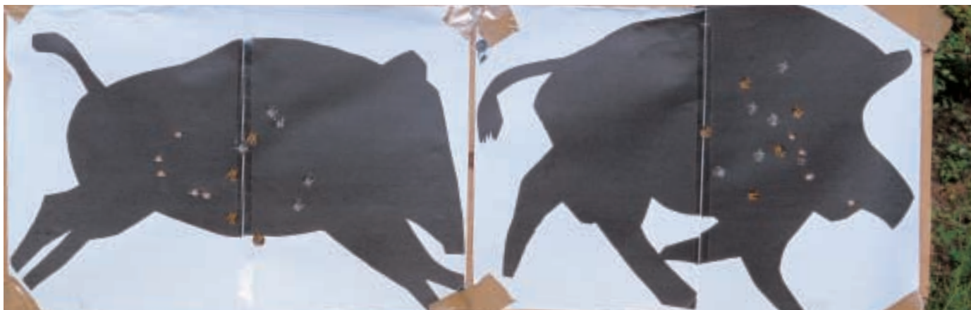
Von links nach rechts geschossen: Mit dem Zielfernrohr saßen alle Schüsse zu weit hinten (l.) Der Referenzschütze traf am besten mit Kimme-Korn – graue Schusspflaster (r.)

für die Testzwecke bereitstellte und der Firma RUAG, die das Vorhaben mit 180 Patronen RWS 10,7-g-KS unterstützte.