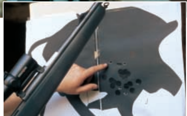
Auf 25 Meter: Trefferbild mit „Hitpoint“ geschossen (r.)

und Wehe, Glück und Verzweiflung. Kürt das Drückjagdzielfernrohr den Jagdkönig, puscht das Reflexvisier das Waidmannsheil oder macht das Rotkorn den Meister? Fragen, die ein standardisiertes und in dieser Kombination noch nie zuvor durchgeführtes Schießstand-Programm beantworten sollte. Jenes berücksichtigt den Schuss im Nahbereich unter Zeitdruck ebenso wie den auf drückjagdübliche Distanzen hingeworfenen. Mit einer R 93 Professional im Kaliber .30-06 wurde eine durchaus gängige drückjagdtaugliche Büchse gewählt, die mit verschiedenen Zieleinrichtungen be-