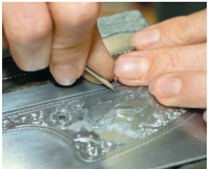
Für feine Arbeiten, bei denen die Oberfläche „gefinisht“ wird, benutzt die Graveurin einen zierlichen Handstichel