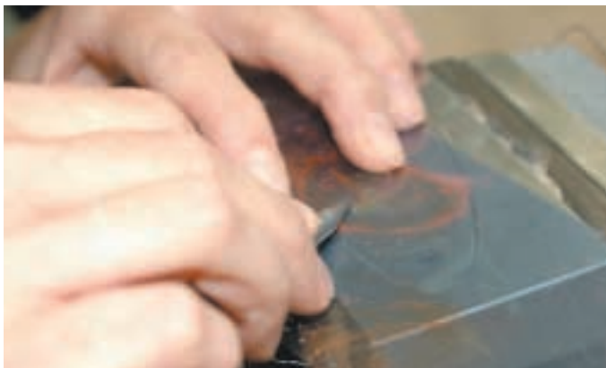
Mit Hilfe von Paraffin, Bildnegativ, Farbpulver und Reißnadel wird das erste Tierstück – ein Fasan – auf die Seitenplatte gebracht

„Fahrzeug- und Jagdwaffenwerk Ernst-Thälmann“, besaß aber seinerzeit schon einen ausgezeichneten Ruf – sowohl national als auch international. Die Suhler waren im Arbeiter- und Bauernstaat mit ihren Kipplaufbüchsen die Devisen-Bringer schlechthin.