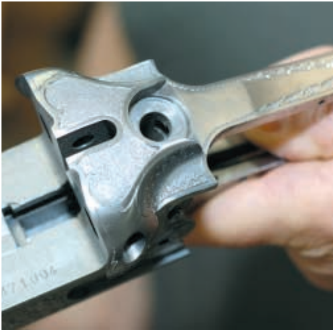
Dieses System gehört zu einer Merkel 50 E. Sie wird schon bald von zwei liebevoll gearbeiteten Seitenplatten geschmückt werden

sicht! Wer bereits von der Fülle möglicher Motive in den Verkaufskatalogen „erschlagen“ wird, der sollte um die Gravurmappe von Dorothee Holland-Merten und Kollegen besser einen großen Bogen machen. Fein säuberlich haben die Spezialisten über Jahrzehnte Fotos und Zeichnungen von Gravuren gesammelt, die hier angefertigt wurden. Wer zwar weiß, dass er eine Merkel möchte, jedoch noch unschlüssig ist, wie deren Seitenplatten aussehen sollen – findet hier höchstwahrscheinlich eine Antwort darauf. „Es gibt tausende Möglichkeiten!“, fasst es Dorothee Holland-Merten zusammen und strahlt sichtlich stolz.