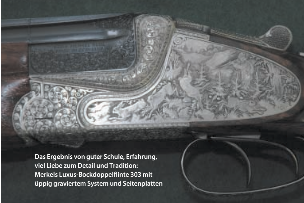
Das Ergebnis von guter Schule, Erfahrung, viel Liebe zum Detail und Tradition: Merkels Luxus-Bockdoppelflinte 303 mit üppig graviertem System und Seitenplatten

Punzen zum Einsatz. Als Laie verliert man schnell den Überblick über die verschiedenen Werkzeuge, sehen sie doch alle irgendwie gleich aus. Die Graveurin hat jedoch alles fest im Griff und arbeitet wieselflink am Jagdmotiv weiter. Erst bei genauestem Hinsehen erkennt man die kleinen Unterschiede.