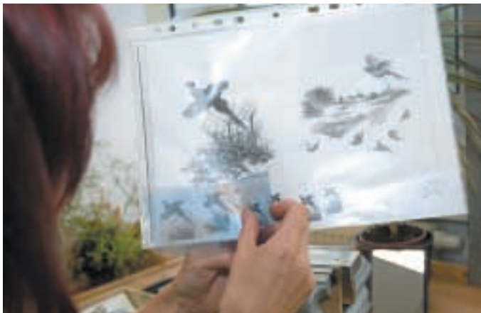
Bevor es ans Gravieren geht, werden die passenden Motive für die Seitenplatten der Doppelfinte ausgesucht