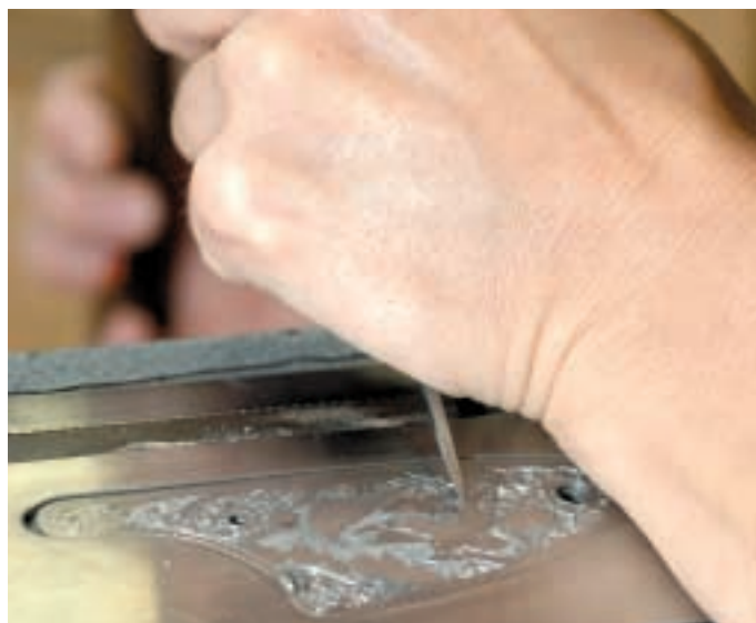
Gefühlvolle Schläge treiben den Stichel ins harte Material und lösen dabei winzige Metallspäne heraus – das Jagdmotiv nimmt Gestalt an