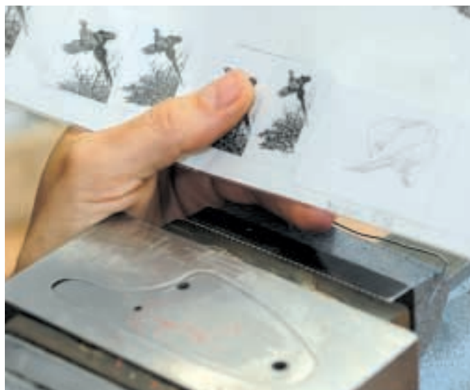
Nach dem vorsichtigen Abheben der Folie bleibt auf der vorher aufgetragenen Paraffinschicht der Umriss des Hahnes zurück