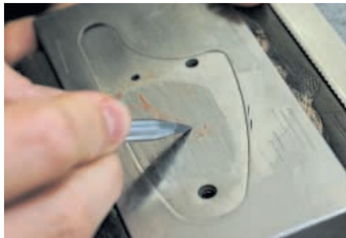
Anschließend ritzt die Suhlerin mit einer Reißnadel den Gockel in die stählerne Seitenplatte

Das Hauptgeschäft wird allerdings nach wie vor mit Standard-Gravurarbeiten gemacht, wobei der Begriff Standard die Sache nicht wirklich trifft. Denn auch viele der Arbeiten im unteren Preissegment werden von Hand gestochen und nicht gelasert oder gewalzt. In letzter Zeit geben immer mehr Kunden Luxus-Gravuren in Auftrag – Arbeiten, die diese Bezeichnung wirklich verdienen, weil selbst verwöhnte Auftraggeber glänzende Augen bekommen, wenn sie das Ergebnis in den Händen halten. Doch Vor-