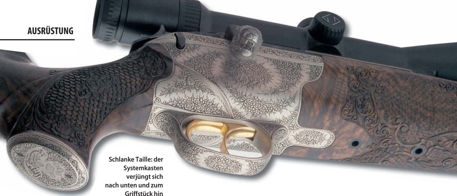
Schlank Taille: der Systemkasten verjüngt sich nach unten und zum Griffstück hin

Wenn aus zwei R 93 eine mit zwei Läufen gemacht werden soll, gilt es zunächst einmal, beide Läufe zusammen mit dem jeweiligen Radialbund-Verschluss zu einer Einheit zu verbinden. Daraus resultiert eine Mindestbreite im Bereich der Verriegelung. Diese misst doppelt so viel wie jedes Einzelelement und benötigt einen entsprechend dimensionierten Kasten. Der erschwert selbstredend eine filigrane Bauweise. Weil der Scheich dennoch optisch eine Bauchtänzerin und keine Walküre wollte, blieb nur die Möglichkeit, das Laufbündel so schlank wie möglich zu halten. Das geht aber nur mit dünnen Wandungen der Läufe, die miteinander schwingungsstabil verlötet werden. Damit wichen die Schwaben gezwungenermaßen von ihrer Praxis ab, durch frei liegende und frei schwingende Läufe optimale Schussleistung aus der jeweiligen Laufkombination zu kitzeln. Sie löteten also die Läufe hinten in ein Brillenstück ein und in ihrer Länge ebenfalls per Weichlot zusammen. An der Unterseite des Brillenstücks sitzen die Stehbolzen, und die Oberseite bildet die Basis für eine Zielfernrohr-Montage à la Mauser M 03. Jene erlaubt bei der vorliegenden Konstruktion einen niedrigeren Sitz des Zielglases als etwa die Sattelmontage. (Letztere hätte nämlich gleichsam als Höcker noch oben draufgepackt werden müssen). Wie beim R 93 lässt sich das Laufbündel der nach dem Auftraggeber „Duo Hamed“ genannten Variante jederzeit und auf die gleiche Weise gegen ein anderes tauschen. Einfach den Verschluss