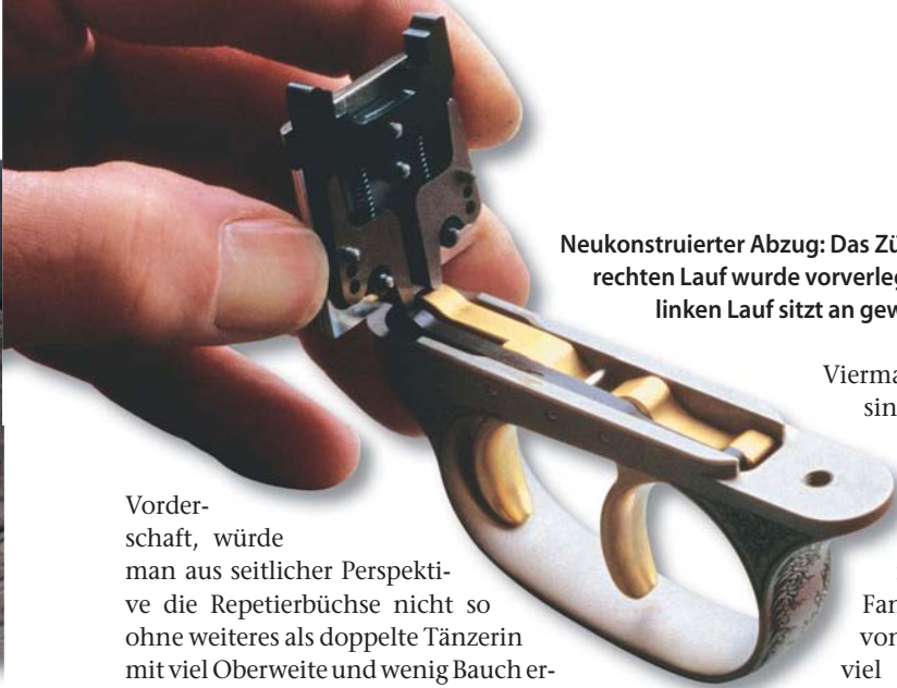
Neukonstruierter Abzug: Das Zügel für den rechten Lauf wurde vorverlegt, das für den linken Lauf sitzt an gewohnter Stelle

Vorderschaft, würde man aus seitlicher Perspektive die Repetierbüchse nicht so ohne weiteres als doppelte Tänzerin mit viel Oberweite und wenig Bauch erkennen. Mit seinen 57,5 Zentimeter langen Läufen wiegt der patronenlastigste R 93 im Kaliber .30-06 nicht mehr als 4 400 Gramm. Die lassen sich ohne Mühe stemmen. Im Anschlag wiederum entpuppt sich der Duo schnell als feuriger, flinker Araber und nicht als schwerfälliges Schlachtross.