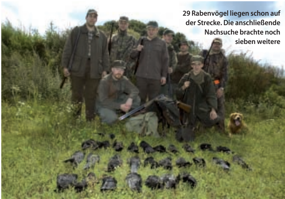
29 Rabenvögel liegen schon auf der Strecke. Die anschließende Nachsuche brachte noch sieben weitere

denkt an die Bauern, die sich gehörig über die riesigen Schäden erschrecken werden. „Da muss was passieren. Es ist im Übrigen nicht wichtig, wie viel Krähen man geschossen hat, sondern wieviele es im Revier noch gibt“, pflegt Meyer immer zu sagen.