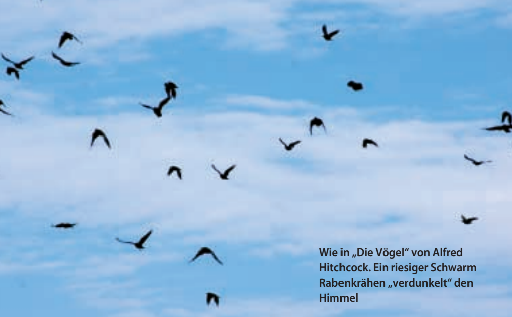
Wie in „Die Vögel“ von Alfred Hitchcock. Ein riesiger Schwarm Rabenkrähen „verdunkelt“ den Himmel

Doch als die Räuber schon fast auf Schrottschuss-Entfernung heran sind, bleiben sie für einen Augenblick in der Luft stehen, rudern wild mit den Schwingen, krächzen lautstark und drehen mit hastigem Flügelschlag ab. Noch lange sind ihre schimpfenden Rufe zu hören. „Mist!“, flucht der 36-Jährige leise. „Irgendetwas stimmt da nicht. Vielleicht liegt eine der geschossenen Krähen auf dem Rücken“, ruft ihm sein Nachbar zu.