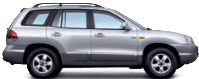
Der Hyundai Santa Fe. Der Sportsroader. Ab 19.490 EUR*