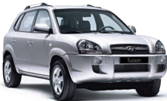
Der neue Hyundai Tucson. Der Cityroader. Ab 18.690 EUR*

Egal, wo Sie die nächsten Stunden verbringen wollen und werden, ob in Ihrem Büro oder in der freien Natur. Unsere Modelle Tucson, Santa Fe und Terracan fühlen sich überall zu Hause. Und der Hyundai Terracan bewältigt die Strecke dorthin dann auch noch mit einer besonders großen Anhängelast.