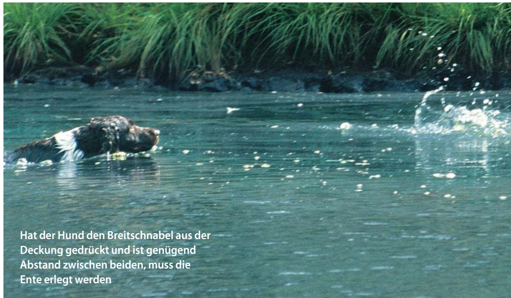
Hat der Hund den Breitschnabel aus der Deckung gedrückt und ist genügend Abstand zwischen beiden, muss die Ente erlegt werden

zeit wird unser Kleiner zum Apportieren geschickt. Die Pause zwischen Schuss und Kommando ist zwingend erforderlich, denn wer kennt sie nicht, die ewigen Winsler und Pfeifer, die einem auf der Entenjagd das Leben schwer machen, wenn sie am Horizont die ersten Enten eräugen, oder das Pfeifen der Schwingen vernehmen. Abgesehen von wenigen Ausnahmen ist diese Unart anerzogen und nicht angewölft.