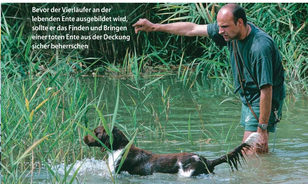
Bevor der Vierläufer an der lebenden Ente ausgebildet wird, sollte er das Finden und Bringen einer toten Ente aus der Deckung sicher beherrschen

herumzukauen. Er lernt dabei, dass eine Handbewegung seines Führers zum Kopf nicht bedeutet, dass er den Gegenstand loslassen darf. Das unschöne Fallenlassen des Wildes kommt meist daher, dass der Führer das Kommando „Aus“ sofort gibt und mit der Hand nach dem Wild greift, wenn der Hund vor ihm sitzt. Der Hund lernt so, die auf ihn zukommende Hand als Sichtkommando „Aus“ zu interpretieren, und lässt das Wild fallen. Die Folge ist, dass der Führer immer schneller zugreift und der Hund Wild immer schneller fallen lässt. Man kann den Hund ruhig einmal ein wenig warten lassen, bis man ihm den Apportiergegenstand abnimmt.