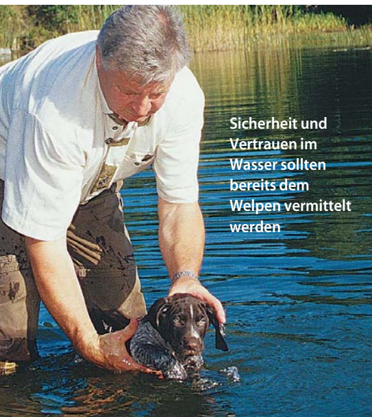
Sicherheit und Vertrauen im Wasser sollten bereits dem Welpen vermittelt werden

Wem die Ausführungen zum Apportieren an Land im Zusammenhang mit der Ar-