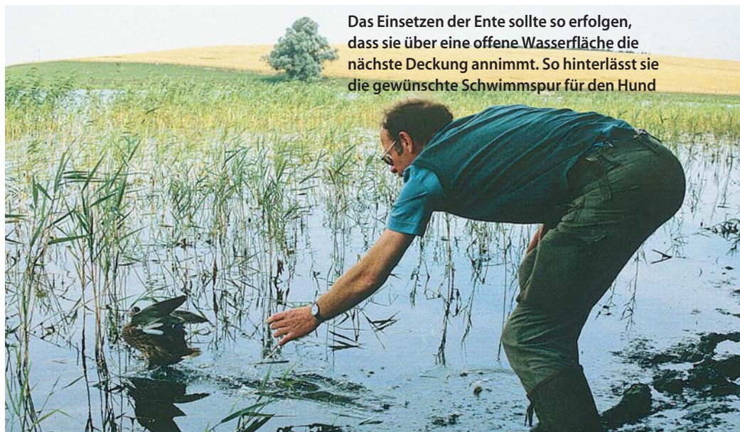
Das Einsetzen der Ente sollte so erfolgen, dass sie über eine offene Wasserfläche die nächste Deckung annimmt. So hinterlässt sie die gewünschte Schwimmspur für den Hund

an der Reizangel präsentiert, ist die Scheu bald überwunden. Im Sommer sollte der „Rudelführer“ auch mal eine Runde mit dem Hund schwimmen, damit die Überwindung immer mehr in Gewohnheit übergeht. Auch mit einem wasserfreudigen Artgenossen im Weiher oder See zu toben, hilft dem jungen „Freischwimmer“. Am besten eignen sich hierfür stehende Gewässer, deren Grund nur langsam abfällt. Solche Bedingungen sind für den Junghund berechenbar. Nach und nach wird er sich vom Ufer lösen und schwimmen.