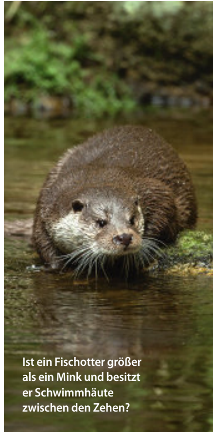
Ist ein Fischotter größer als ein Mink und besitzt er Schwimmhäute zwischen den Zehen?

19. Junge Rebhuhnküken sind zunächst auf welche Äsung angewiesen?