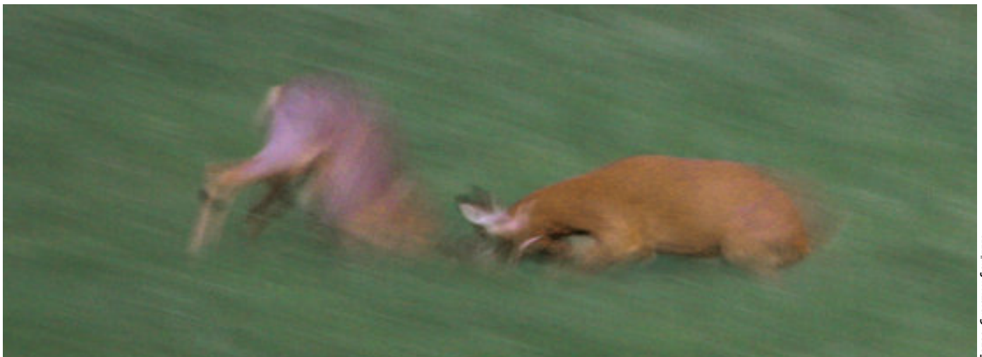
Der Hauptkampf: Ohne Vorwarnung nahm der rote „Teufel“ (re.) den „Weißen Riesen“ (li.) an, nachdem dieser den Gabler von der Heide gefegt hatte. Im Gegensatz zum Vorkampf, war dieser nach wenigen Augenblicken entschieden.