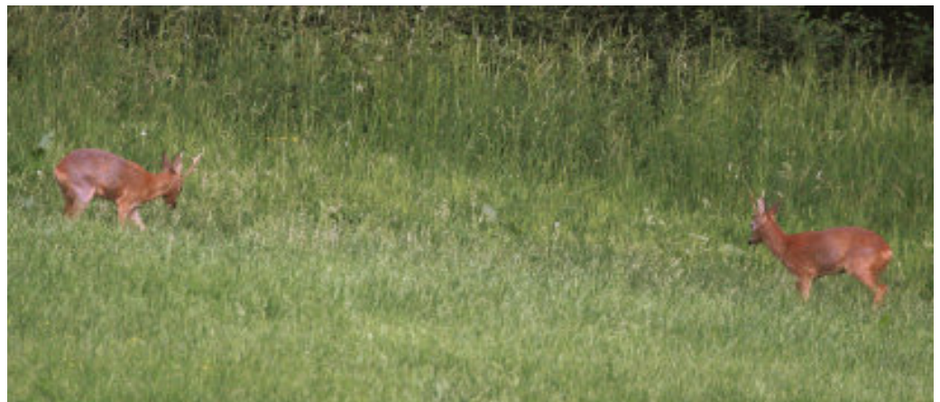
„Weißer Riese“ gegen „Heidegabler“: Plätzen, Lichter rollen, Parallelmarsch und zahlreiche Scheinangriffe bestimmten die Auseinandersetzung der beiden mittelalten Böcke.

Der eigentliche Herr der Heide, der „Heidebock“, dem ursprünglich der Fototermin galt, ließ sich an diesem Abend nicht mehr blicken. Naja – nach der Aufregung! ♦