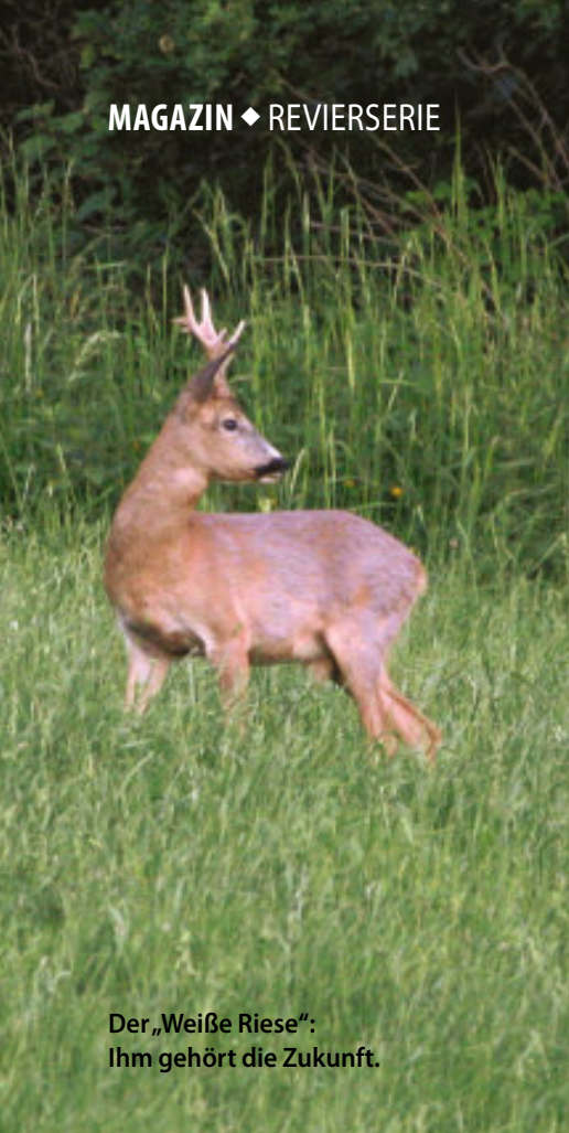
Der „Weiße Riese“: Ihm gehört die Zukunft.