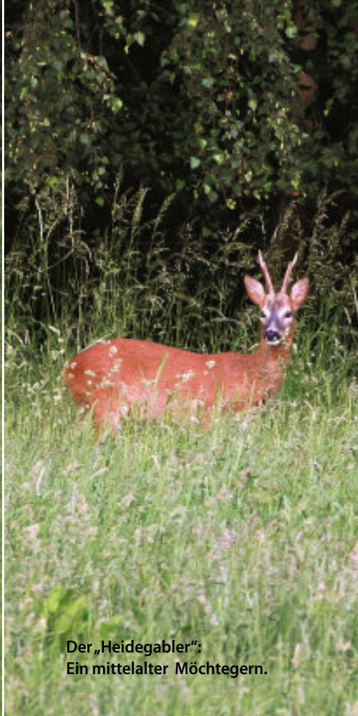
Der „Heidegabler“: Ein mittelalter Mächtiger.