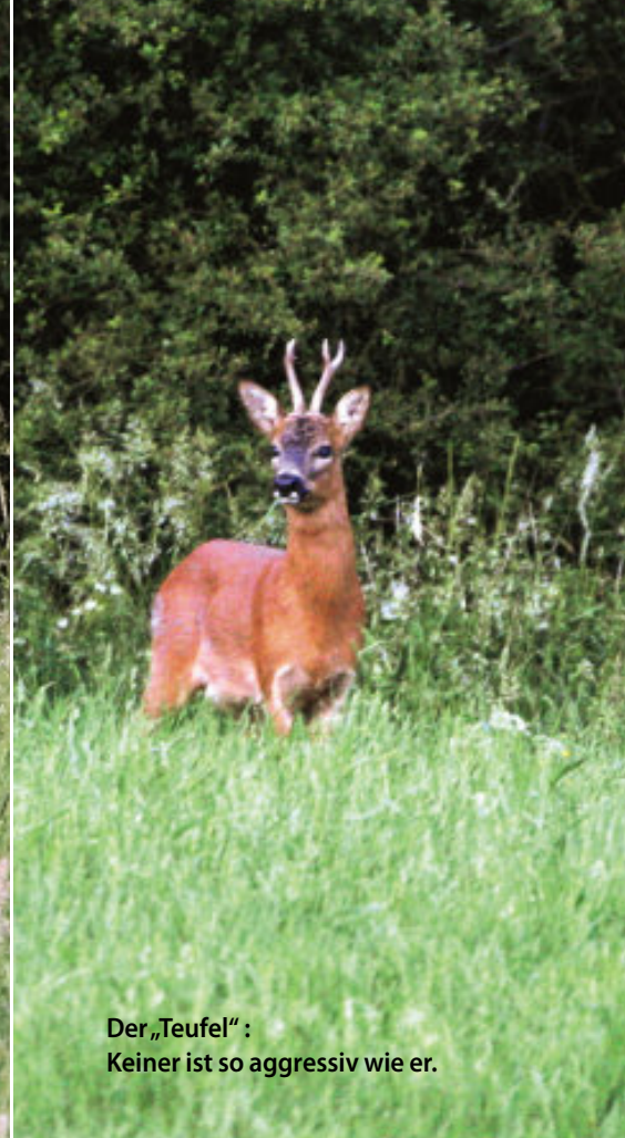
Der „Teufel“: Keiner ist so aggressiv wie er.