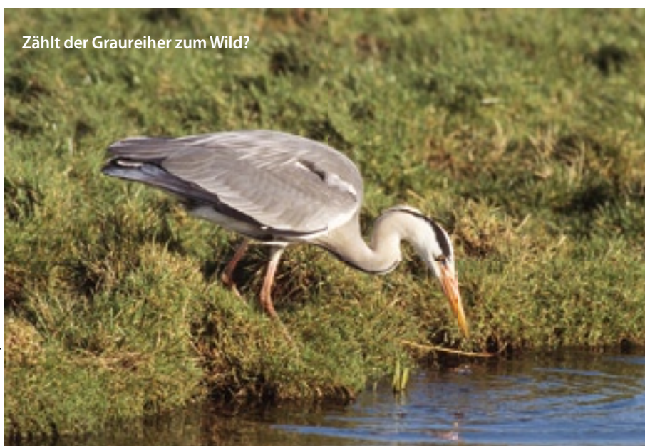
Zählt der Graureiher zum Wild?