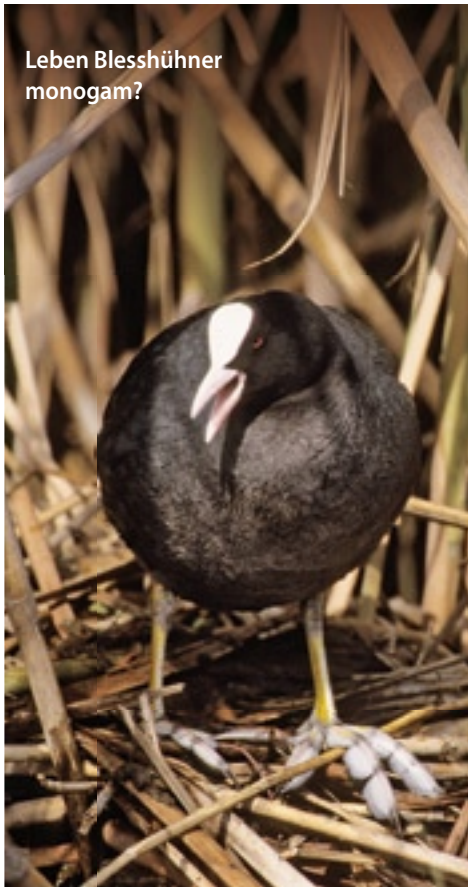
Leben Blesshühner monogam?

Nähere Informationen: Tel.: 0 49 28 / 91 14 37 Ansprechpartnerin: Tanja Saathoff www.hubertusgold.de