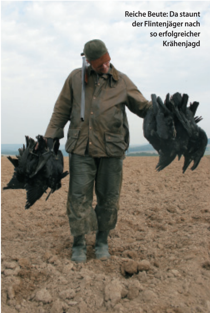
Reiche Beute: Da staunt der Flintenjäger nach so erfolgreicher Krähenjagd